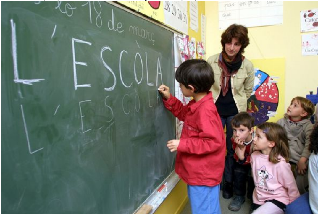
Ecole en langue Occitane à Toulouse. Photo d'archives. • © X De Fenoyl/MAXPPP

Publié le 23/07/2021 à 18h34 • Mis à jour le 23/07/2021 à 18h42